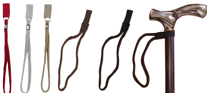
8102 8103 8104 8101 Marrón 810 Negro

Asa cordón negro, marrón, granate, gris ó beige. Aplicación fácil en todo tipo de diferentes diámetros.