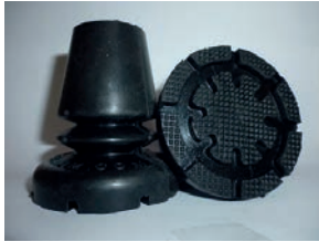
819 Contera con fuelle. Presenta una gran capacidad de flexibilidad que permite un contacto constante de la base al suelo, consiguiendo una alta adherencia y gran capacidad de absorción a los impactos. Diámetro de base 5,5 cm.

Su gran flexibilidad permite que una parte importante de su base siempre apoye. Su forma especial consigue un alto grado de amortiguación, reduciendo las lesiones de codos y hombros de sus usuarios.