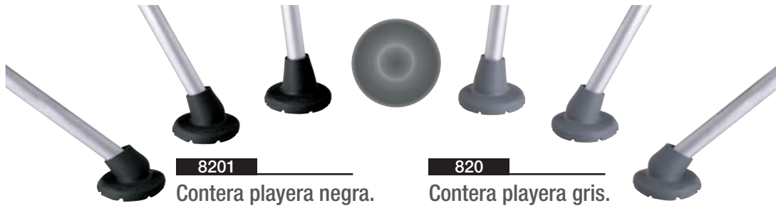
8201 Contera playera negra.